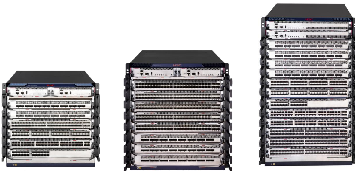
S10500X-G 系列以太网核心交换机

H3C S10500X-G 系列交换机产品是新华三技术有限公司（以下简称 H3C）面向云计算数据中心核心、下一代智慧园区核心专门设计开发的产品。S10500X-G 基于 H3C 自主知识产权的 Comware V7 操作系统，为客户提供可信、安全的平台。主控、网板、风扇、电源等关键器件冗余设计，提供电信级高可靠保障。支持高密 GE/10GE/25GE/40GE/100GE 以太网端口，VXLAN、MDC、M-LAG 和 IRF2 等主流技术，融合了 MPLS VPN、IPv6、无线、流量分析等多种网络业务。同时，H3C S10500X-G 采用绿色节能的环保设计工艺，符合“限制电子设备有害物质标准（RoHS）”。